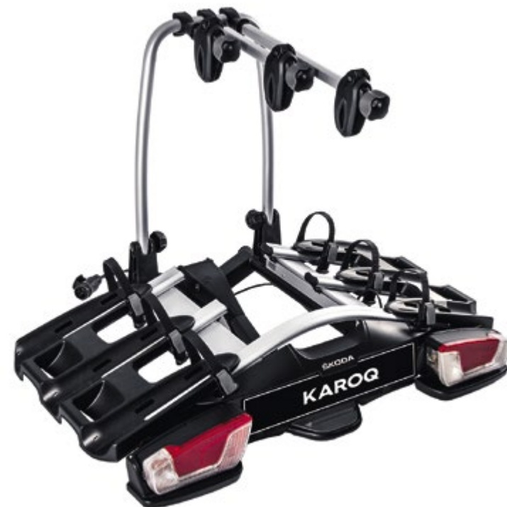
Portabicicletas para enganche de remolque: capacidad para 3 bicicletas

000 071 105P | para LHD 000 071 105Q | para RHD