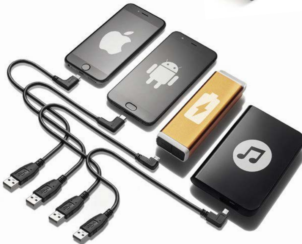
SmartLink+ 000 054 830A solo disponible para Swing