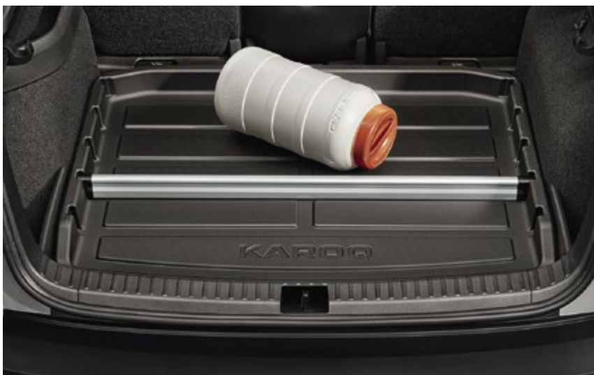
Separación de aluminio para la bandeja de plástico del maletero