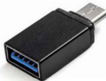
Adaptador USB C a USB A 3.0 000 051 443J