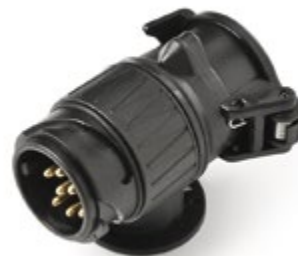
Adaptador (de toma de 7 a 13 clavijas) EAZ 000 001A