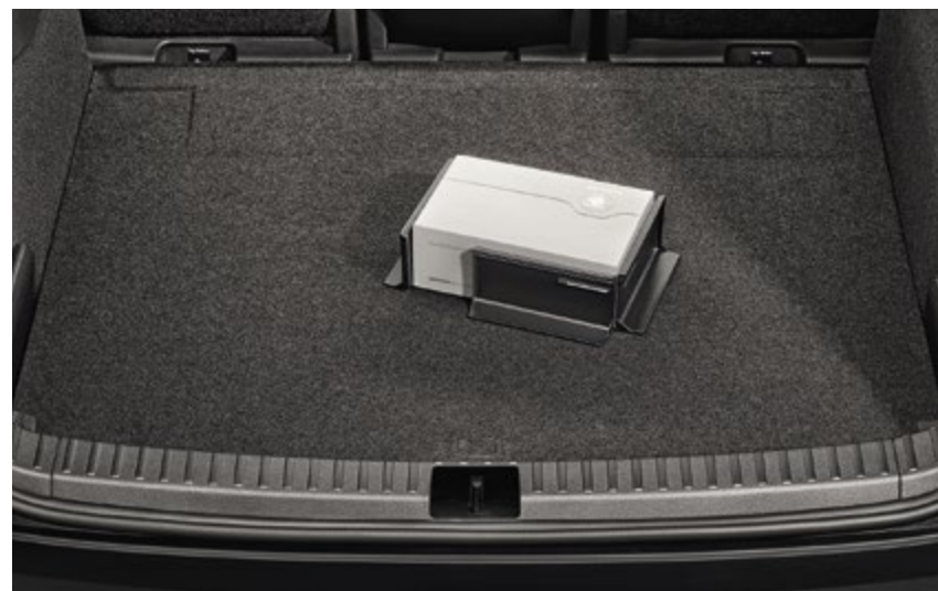
Elemento de fijación universal